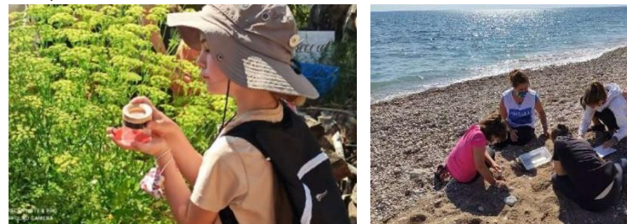
Accions de divulgació i voluntariat.